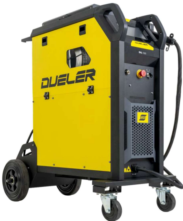
Dueler EHL 1500